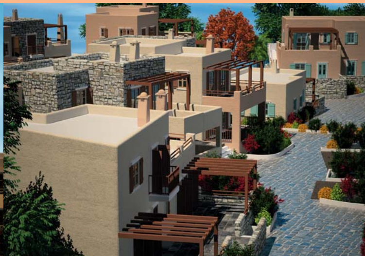
Εξωτερική όψη Συγκροτήματος με επένδυση πέτρας Σύρου