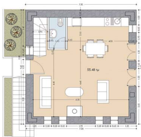
2 bedroom maisonette